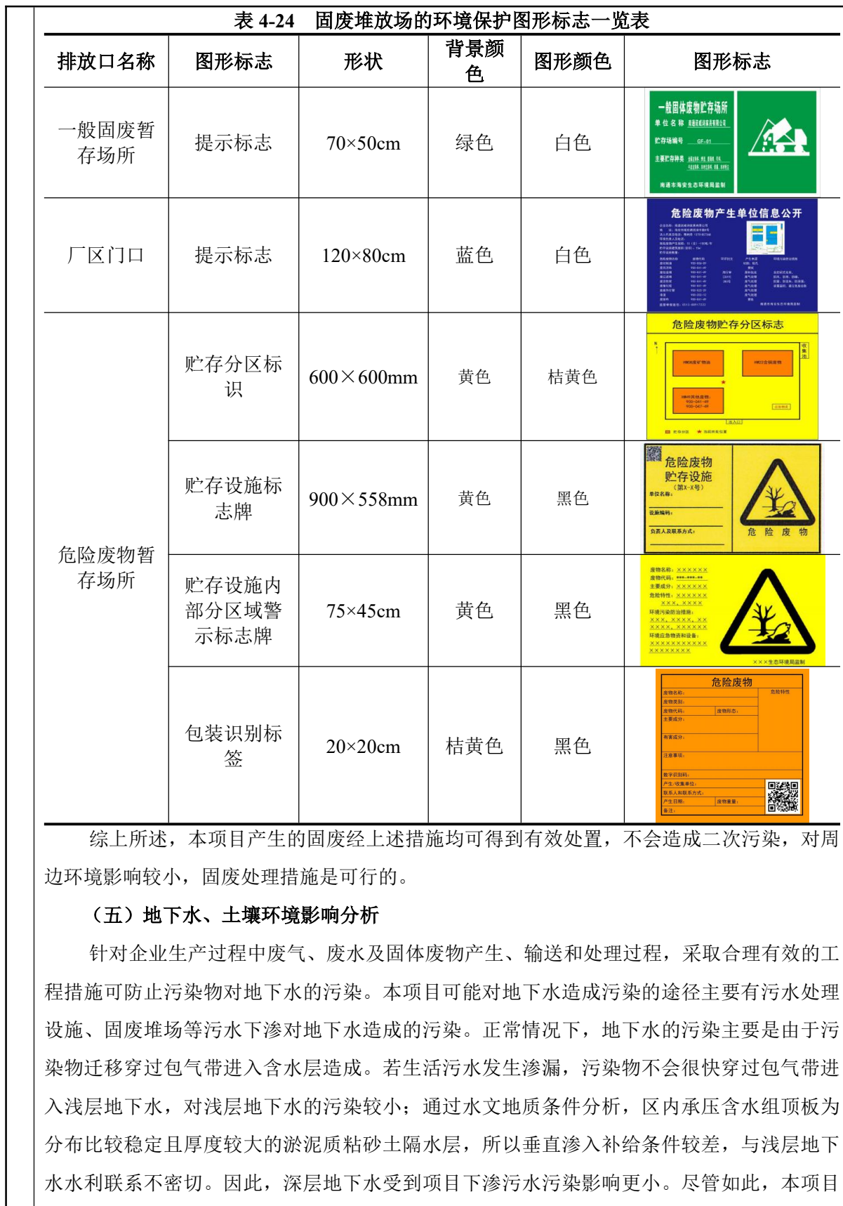
表 4-24 固废堆放场的环境保护图形标志一览表